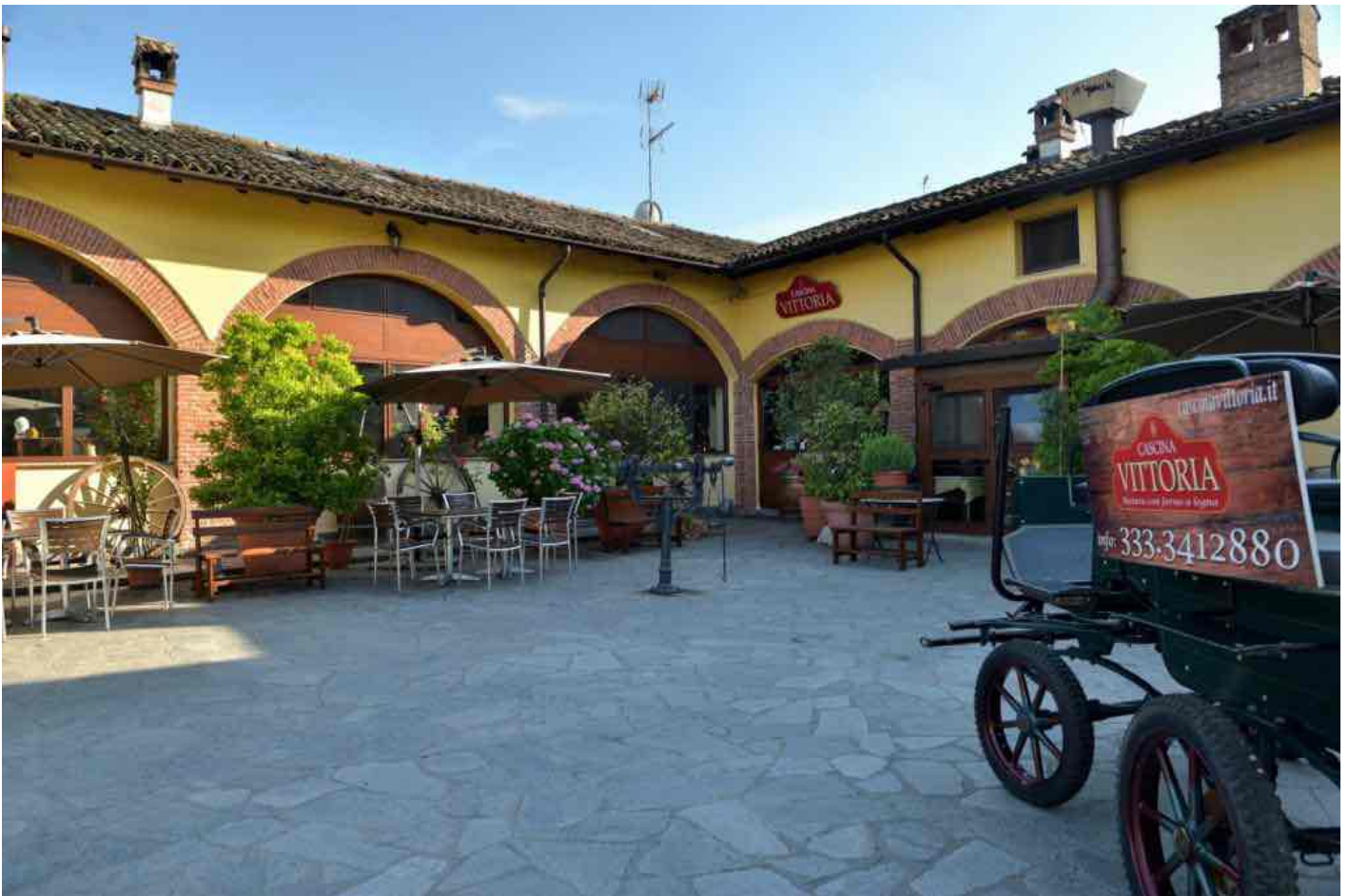
L'ingresso di Cascina Vittoria

ben più celebre famiglia di Nazareth nella notte del 24 dicembre. “Non c’è posto, non c’è posto”. Non avevamo nessun salvatore dell’umanità da far nascere, a dire il vero, ma solo una fame che cresceva assieme al numero mostrato dal contachilometri e un cane col naso asciutto, accaldato e già lievemente cardiopatico. Vi ricordate Marina Massironi che con accento americano esclamava ‘Bisogna sempre preenotare!’. Ecco, aveva totalmente torto. Perché se avessimo prenotato da qualche parte non avremmo scoperto la Cascina Vittoria di Rognano.