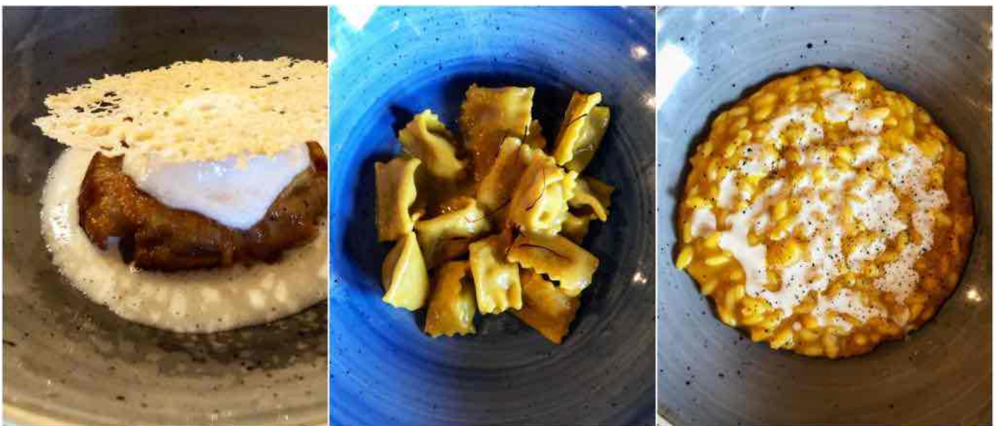
La millefoglie di melanzana, gli agnolotti del plin, il risotto. Una mano salda.

di Kobe, ma è comunque una carne ben marezzata e saporita oltremodo che dopo un passaggio sulle braci canta. Le patate invece cuociono nel forno a legna e cantano pure quelle. La pizza non l'abbiamo assaggiata, a dire il vero, ma cuoce nello stesso forno a legna, l'impasto è composto da farine Petra e quel vecchio lievito madre e crece per 72 ore (e recentemente ha ricevuto due spicchi dalla guida del Gambero Rosso ). Me la tengo per la prossima volta, mentre non rinuncio agli incredibili sorbetti di frutta (prendete il kiwi per sognare) e soprattutto alla colomba alle albicocche campane che è uno strepitoso dolce edizione limitata candidato, secondo gli esperti, ad essere una delle migliori colombe dell'anno.