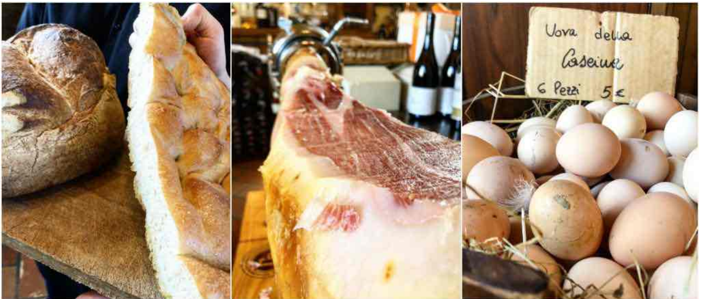
Pane e focacce fatte in casa, pata negra in bella vista, uova della cascina a metro 0.

cose buone ma è più buono di queste tante cose. Lo mangerei quotidianamente. Gli agnolotti del plin hanno 40 (quaranta!) tuorli per chilo di farina, e si sente: la pasta é ricca, spessa, sa di uovo. Anche perchè le uova vengono dalla cascina stessa e costano più o meno come quelle di Parigi. Sono fresche ed eccezionali, come la mantecatura allo zafferano dei suddetti agnolotti. L'altro primo che ci fanno assaggiare è un riso Riserva San Massimo , ora generalmente considerato come lo champagne dei Carnaroli, mantecato con crema di zucca, salsa di gorgonzola e liquirizia . Un classico domenicale della nonna che diventa raffinatamente buono con quel chicco grosso e al dente e una delicatezza generale che non ti aspetti dall'accostamento. I secondi sono un giro di giostra.